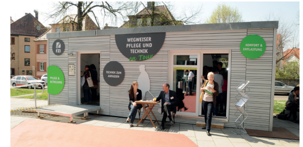
Rollende Ausstellung des Forschungszentrums Informatik Karlsruhe

Im Ausstellungscontainer können Sie Produkte ansehen und ausprobieren, die den Alltag erleichtern.