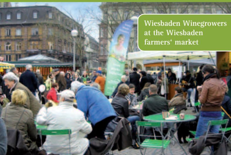
Wiesbaden Winegrowers at the Wiesbaden farmers' market

Bis zum 21. November 2015 finden Sie samstags von 8 – 14 Uhr auf dem Wochenmarkt den Weinstand der Wiesbadener Winzer. Dort präsentieren sich im Wechsel die verschiedenen Weingüter mit ihren Erzeugnissen.