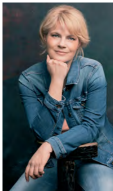
Nele Neuhaus

Nele Neuhaus ist eine der erfolgreichsten deutschen Kriminalautorinnen. Ihre fünf bisher erschienenen Taunuskrimis erreichten bis jetzt eine Gesamtauflage von zwei Millionen Exemplaren, die Druckrechte wurden in 20 Länder verkauft. Nur so viel sei vorweg verraten: Das Buch „Böser Wolf“, das Mitte Oktober erscheint, handelt von einer 16-jährigen, die an einem heißen Julitag bei Eddersheim tot aus dem Main geborgen wird. Der Täter hatte sie misshandelt und ermordet und niemand schien sie zu vermissen. Erste Spuren führen zu einem Kinderdorf im Taunus und zu einer Fernsehmoderatorin, die bei ihren Recherchen den falschen Leuten zu nahe kommt. Ein weiterer höchst mysteriöser Fall für das Ermittler-Duo Oliver von Bodenstern und Pia Kirchhoff.