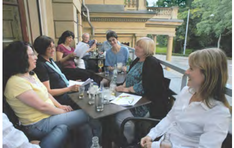
Autorenstammtisch Dostojewskis Erben

Der 8. Dezember ist der Todestag von Friedrich Glauser, der mit seinem Wachtmeister Studer ein Vorbild für viele Kriminalromane geschaffen hat. Die Autorengruppe Syndikat e.V. veranstaltet ihm zu Ehren jedes Jahr den Krimitag, der aus vielfältigen lokalen Ereignissen besteht.