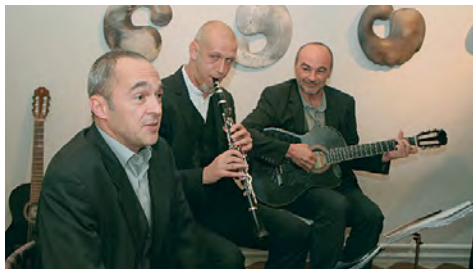
Trio Lepschi