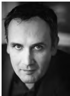
Volker Kutscher