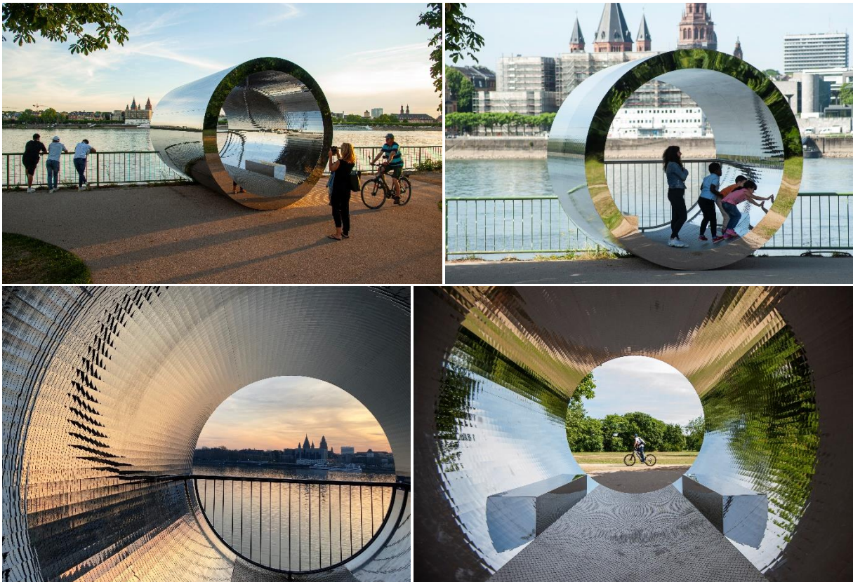
Skulptur „Dem Wasser gewidmet“ - Impressionen

Hintergrund und Projekthistorie zur Skulptur "Dem Wasser gewidmet" von Winter/Hoerbelt: Dem Wasser gewidmet | Landeshauptstadt Wiesbaden