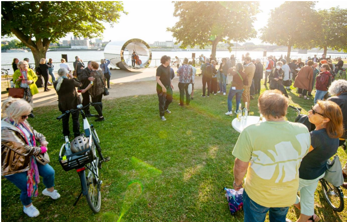
Einweihung der Skulptur im Mai 2022 - Beziehung zwischen Musiker und Publikum bzw. Radweg und Grünfläche