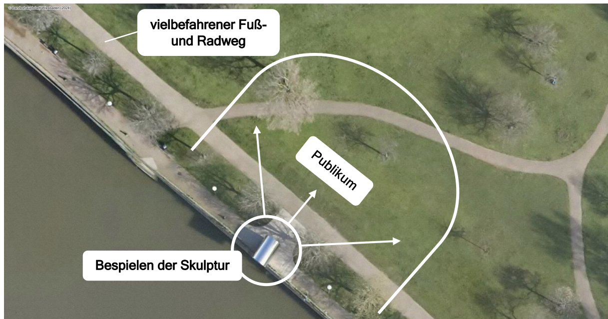
Räumliche Gegebenheiten