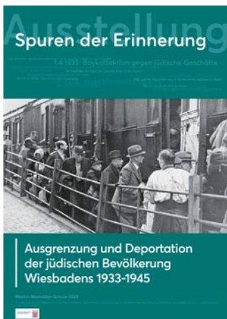
Plakat zur Ausstellung © Martin-Niemöller-Schule

Ziel der Ausstellung ist es, das Wissen über die Shoah lokalgeschichtlich zu konkretisieren, an lokale Erinnerungsorte zu koppeln und zu vermitteln. Zugleich soll eine Brücke zur Nachkriegsgeschichte und Gegenwart der Jüdischen Gemeinde geschlagen werden.