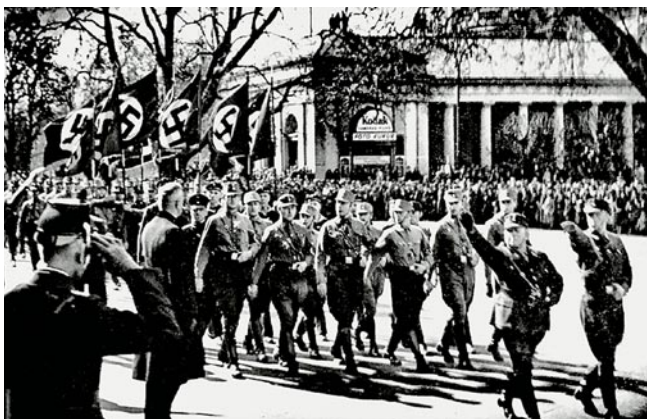
Die SA marschiert vor dem Wiesbadener Kurhaus