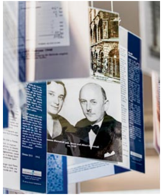
Blick in die Ausstellung „Gegen das Vergessen“.

80 Jahre nach den großen Deportationen Wiesbadener Jüdinnen und Juden