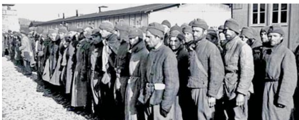
Sowjetische Kriegsgefangene 1941 im KZ Mauthausen.

Der Vortrag beleuchtet ebenso die völkerrechtlichen Rahmenbedingungen für die Kriegsgefangenenpolitik der Wehrmacht, wie die Frage, inwieweit diese völkerrechtlichen Vorschriften beachtet wurden. Zwar erließ die Wehrmacht die Richtlinien zur Behandlung Gefangener gemäß den Bestimmungen des Genfer Abkommens, tatsächlich schuf sie aber von Anfang an eine Rangordnung unterschiedlicher Rechte und Rechtssicherheit für die verschiedenen Gefangenengruppen. Diese Praxis gipfelte in der verbrecherischen Behandlung der rund 5,7 Millionen sowjetischen Kriegsgefangenen in deutscher Hand ab Juni 1941, von denen bis zu 3,3 Millionen ums Leben kamen. Deren Schicksal in den Lagern und beim Arbeitseinsatz im Reichsgebiet gilt das Hauptaugenmerk des Vortrags. Abschließend soll kurz gezeigt werden, aus welchen Gründen das Schicksal der sowjetischen Kriegsgefangenen nicht nur in den Nachbarstaaten des „Dritten Reiches“, sondern auch in der Sowjetunion lange Zeit keine Beachtung fand.